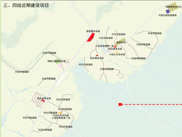
村庄规划近期重点建设项目表